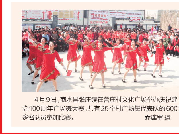
4月9日,商水县张庄镇在董庄村文化广场举办庆祝建党100周年广场舞大赛,共有25个村广场舞代表队的600多名队员参加比赛。

物,在该刊物上开设党史学习教育专题专栏,设置了《上级部署》《地方动态》《学习资料》三个栏目,通过党史知识介绍、党史人物研究等方式,持续营造党史学习教育氛围;打造智慧校园,持续推进“党史学习教育”微课课和“5H”课程的开发及视频录制,并通过县电视台、“红色微家园”微信公众号等移动终端播出。(赵钧)