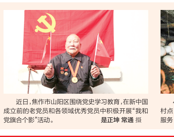
近日,焦作市山阳区围绕党史学习教育,在新中国成立前的老党员和各领域优秀共产党员中积极开展“我和党旗合个影”活动。