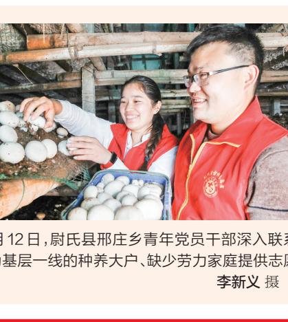
4月12日,尉氏县邢庄乡青年党员干部深入联系村点,为基层一线种养大户、缺少劳力家庭提供志愿服务。