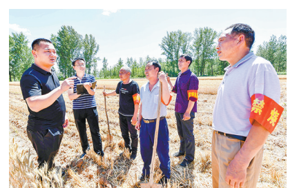
6月5日,宜阳县三乡镇党员干部在农田里督导禁烧工作。“三夏”期间,该镇由党员干部组成5个“禁烧小组”对全镇27个行政村的禁烧工作进行督导,确保“三夏”期间不冒一股烟,不着一堆火。