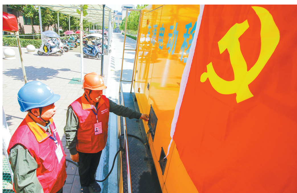
6月7日~8日是一年一度的高考,为确保今年高考各考点正常供电,国网汝阳县供电公司结合考点分布特点,制订了高考保电应急预案,组织共产党员服务队对考点相关供电线路、设备以及校内供电线路进行全面巡视检查,为高考考点配备应急电源车、UPS电源,随时应对突发情况。