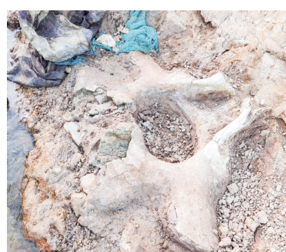
大象盆骨化石

本报讯(记者张鸿飞 通讯员李峰)继郑州、安阳等地发现大象化石后,汝州也发现了大象化石。