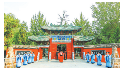
理学圣地二程故里