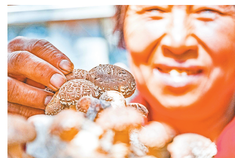
嵩县是全省最大的夏香菇种植基地