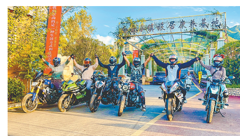
白云小镇游客如云