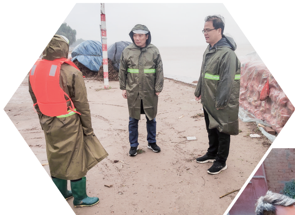
▲ 郟县纪委监委扎实开展“我为群众办实事”实践活动，着力解决好群众的操心事、烦心事、揪心事。图为近日，该县纪检监察干部到马坊镇马坊寨村走访脱贫户。

为确保下拨的专项养老资金合理安排使用，郑州市纪委监委第四监督检查室联合市民政局纪检监察组成立专项督查组，对养老资金进行监督检查。对养老服务工作中存在弄虚作假、监管缺位、敷衍塞责等不作为、假作为的形式主义官僚主义问题进行梳理和汇总，督促主管部门加强监管、完善机制，以强有力的监督保障养老服务政策落到实处。(毛伟传 张龙)