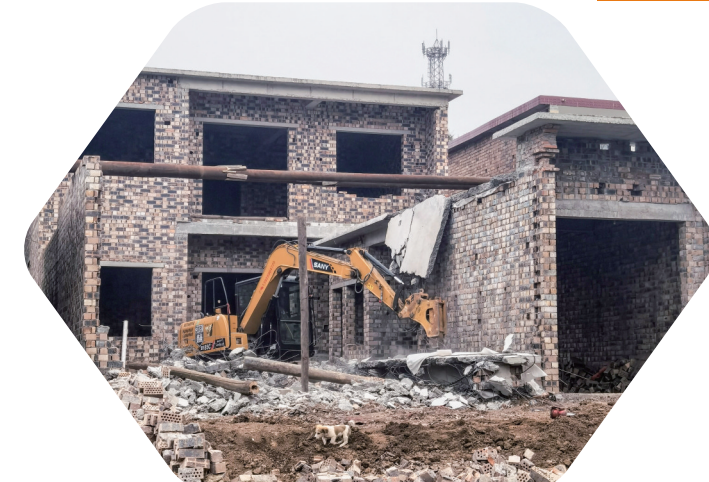
10月29日，蟒川镇依法拆除西村一处违建建筑。在坚守耕地红线工作中，该镇组织密织镇、村和包村干部、驻村第一书记、村级网格员、村级土地协管员五级防线，从源头着手，确保违法占用耕地零增量。