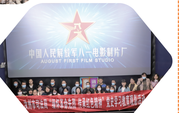
10月28日下午，汝州市司法局组织党员干部观看爱国主义教育电影《长津湖》。为丰富党史学习教育内容，进一步引导党员干部“学史明理，学习增信，学史崇德，学史力行”，激发党员干部凝聚奋进力量，汝州市司法局组织了此次观影活动。