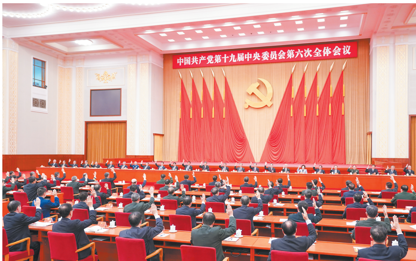
中国共产党第十九届中央委员会第六次全体会议,于2021年11月8日至11日在北京举行。中央政治局主持会议。