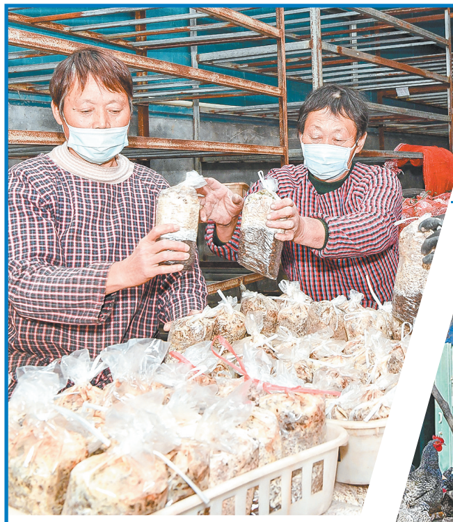
11月28日,在民权县龙塘镇天邦农业科技食用菌工厂内,工人在管理菌棒。该公司2万平方米食用菌培育车间内配备了智能化设备,目前这里务工的农户有70多人,最多时有260多人。

立足“高效率”,提升服务质量。该公司在咨询、受理、现场、审查等各个环节中,实现“一站式”审批和“一条龙”服务,让前来办电的群众尽量“少张一次嘴、少等一分钟、少跑一趟腿”。针对关系民生的重大项目,开通用电报装“绿色通道”,精简办理流程,实行“项目一专员”全程服务制,不断提高客户满意度。