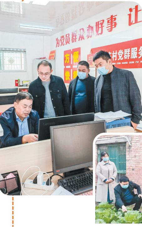
近日，新蔡市曲梁镇纪委对各村阳光监督云平台的信息录入情况进行督导检查，查找各村信息录入盲点，帮助解决信息录入堵点，确保“三资三务”“四议两公开”等数据录入的精准性和时效性。

为认真贯彻落实省、市关于重点时段重点领域安全生产电视电话会议精神，周口市交通运输局开展为期一个月的安全生产除患排险专项行动。周口市纪委监委驻市交通运输局纪检监察组聚焦安全生产监督责任，强力推动全市交通运输系统安全生产除患排险专项行动落实落地。