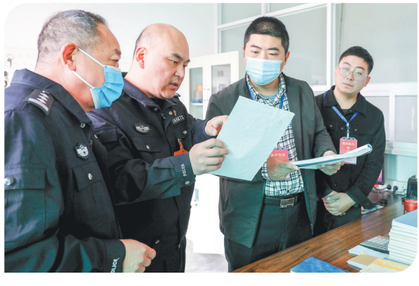
武陟县纪委监委紧盯群众身边腐败问题，强化行业职能部门监督检查。图为近日，该县纪委监委驻县公安局纪检监察组针对事故车辆管理工作跟进监督，严防停车收费“微腐败”。