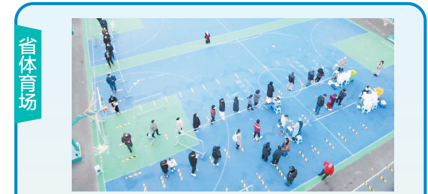
按照郑州市新冠肺炎疫情防控办公室关于开展部分区域全员核酸检测的通告要求,大石桥办事处在省体育场院内西广场设立核酸检测采样点,分别于11月8日、11日和15日,面向辖区群众进行了三轮全员核酸检测工作。

11月15日上午,志愿者们身着红马甲,头戴小红帽,在人群中来回奔波,引导大家戴好口罩,保持一米间隔有序排队,协助老弱、病残、孕幼等特殊人群在绿色通道检测,防止人员聚集、扎堆,同时耐心解答居民提出的各种问题,大家忙碌的身影成为冬日一道温暖的红色风景线。