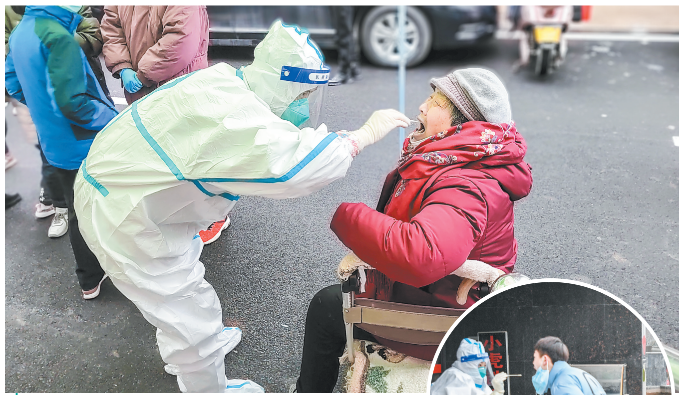
▲近日,郑州大学第五附属医院核酸检测筛查队全面落实上级疫情防控工作部署,先后转战二七区、高新区、航空港区多个核酸采样点开展筛查工作。