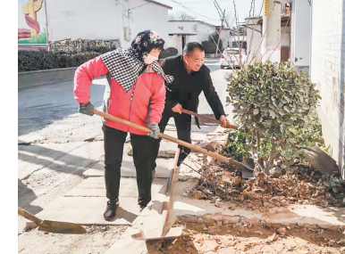
4月8日，安阳市殷都区曲沟镇80余名机关干部下沉到17个行政村，拿起扫帚、铁锹等工具，和村干部们一起清除杂草、垃圾。本报记者 秦名芳 通讯员 秦利萍 摄

费难题。修武县税务局第一税务分局负责人了解情况后，第一时间为该企业排忧解难。由于社保费标准版系统于4月1日正式上线，面对陌生的操作环境，该局工作人员在3月31日提前加班演练新的社保费标准版系统，熟悉功能菜单。4月1日上午，顺利为焦作煤业（集团）白云煤业有限公司开具社保费缴纳票据，解决了企业缴费难题。