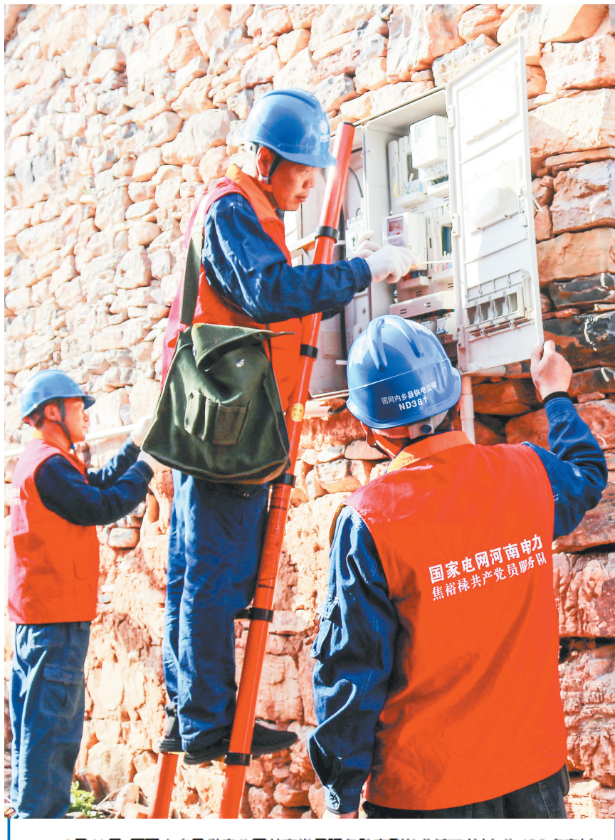
4月11日，国网内乡县供电公司共产党员服务队来到曲曲镇王井村，为100多户村民重新架设供电线路，提升供电水平，为该村发展旅游产业提供电力保障。

数着到手的人民币，丁某某哽咽道：“这下好了，孩子的学费有着落了。”民警还给了丁某某送来午饭，饭后又拿来方便面和火腿肠让他回家路上吃。丁某某又一次哽咽了起来，不断地对民警表示感谢。