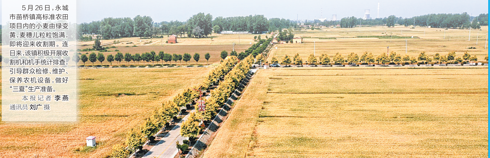
5月26日,永城市苗桥镇高标准农田项目内的小麦由绿变黄,麦穗粒粒饱满,即将迎来收割期。连日来,该镇积极开展收割机和机手统计排查,引导群众检修、维护、保养农机设备,做好“三夏”生产准备。

头的活儿,打开了话匣子:“我从2003年开始承包地种李子树,前些年成立了永城市蜜李家庭农场,目前果园占地50亩,其中李子树42亩、樱桃树8亩,每年七八月份,每天管理、采摘需要10余名劳动力……”2021年,李子亩产3000斤左右,王文杰以每公斤5元的价格卖给了安徽亳州的水果商贩,市场反馈效果很好。 幸福是奋斗出来的,王文杰深谙其理。这些年来,他坚持稳中求进,不盲目、不跟风,在经营好农场的同时,还销售化肥、种子、农药等农资,通过勤奋努力让全家人过上了幸福生活。 “我经常上网关注水果市场行情,希望今年夏天李子能卖个好价钱!”王文杰充满期待地说。