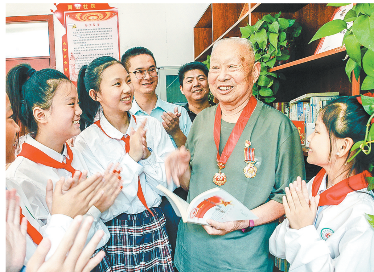
7月31日,尉氏县两湖街道的孩子们在聆听军队退休干部讲述参战保家卫国的故事。“八一”建军节期间,尉氏县在全县中小學生中开展了“听老兵讲故事传承八一精神”爱国主义主题教育,让孩子们近距离感受老一辈军人为国家为人民的无私奉献精神,唤起孩子们的爱国情怀和自强不息、奋发向上的民族自豪感。

“下一步,我们要以‘五星’支部创建为契机,对标创建标准,多元化培育新型经营主体,持续推进壮大乡村产业,不断促进乡村产业提档升级。”增福镇党委书记张涛说。(本报记者 宋广军 通讯员 张浩 李泳霖)