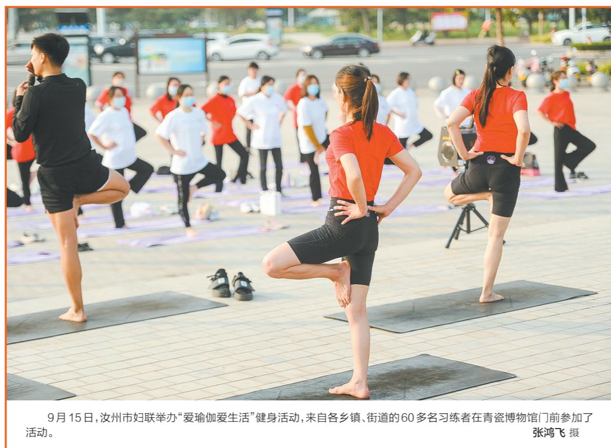
9月15日,汝州市妇联举办“爱瑜伽爱生活”健身活动,来自各乡镇、街道的60多名习练者在青瓷博物馆门前参加了活动。