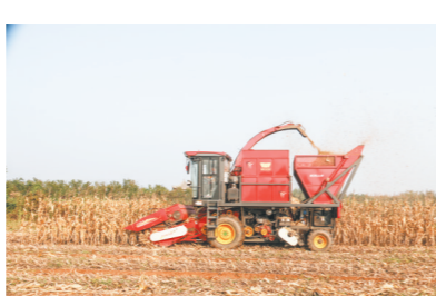
河南天德机械制造有限公司生产的自走式穗茎兼收玉米收获机正在田间作业