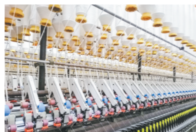
辉县市仙媛纺织有限公司纺纱车间