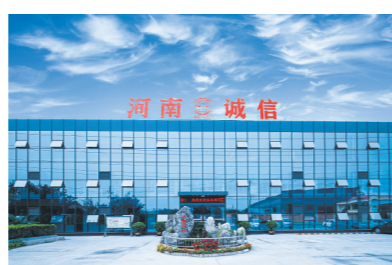
河南诚信密封新材料科技有限公司