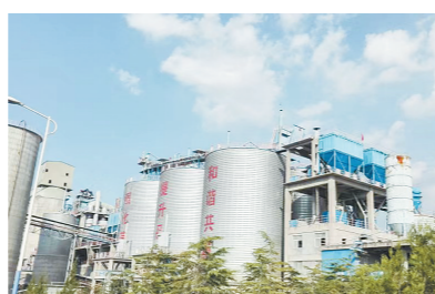
河南省环山环保科技有限公司