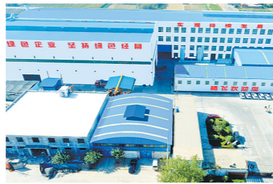
辉县市腾飞机械制造有限公司

营商环境好不好,市场主体说了算。本报记者专访了部分企业、项目负责人,用他们的发展历程和亲身体会生动地阐述辉县市营商环境的提升。