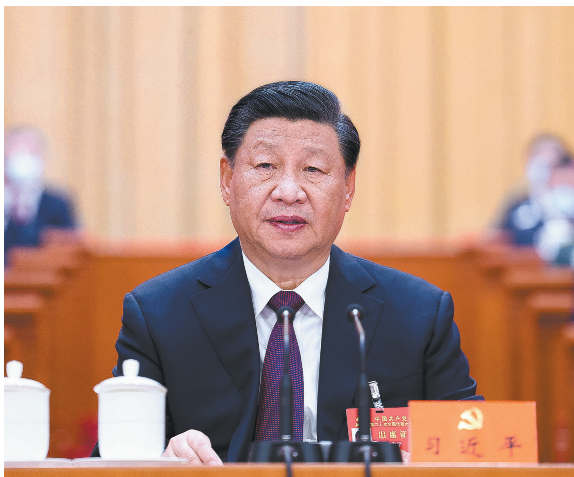
10月22日,中国共产党第二十次全国代表大会在北京人民大会堂胜利闭幕。习近平同志主持大会。

习近平强调,中国共产党走过了百年奋斗历程,又踏上了新的赶考之路。一百年来,党团结带领全国各族人民取得了新民主主义革命、社会主义革命和建设、改革开放和社会主义现代化建设的伟大胜利,开创了中国特色社会主义新时代。百年成就无比辉煌,百年大党风华正茂。我们完全有信心有能力在新时代新征程创造令世人刮目相看的新的更大奇迹。全党要紧密团结在党中央周围,高举中国特色社会主义伟大旗帜,坚定历史自信,增强历史主动,敢于斗争、敢于胜利,埋头苦干、锐意进取,团结带领全国各族人民为实现党的二十大确定的目标任务而奋斗