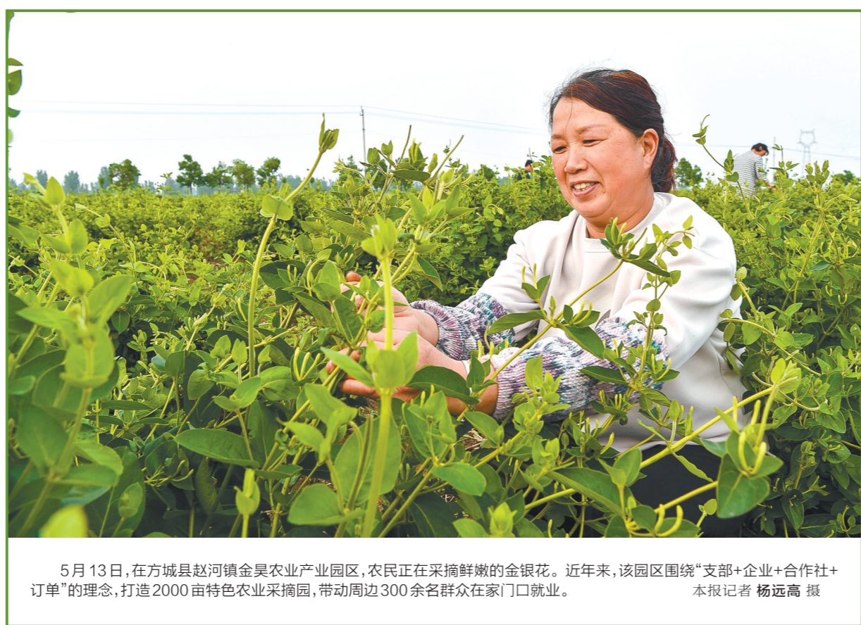
5月13日，在方城县赵河镇金昊农业产业园区，农民正在采摘鲜嫩的金银花。近年来，该园区围绕“支部+企业+合作社+订单”的理念，打造2000亩特色农业采摘园，带动周边300余名群众在家门口就业。

本报（记者吴向辉）5月13日，河南省中药材协会组织开展的2023年度中医药行业知识产权系列培训第一期培训会在郑州举行。来自河南省中药材协会会员单位成员及有关企业负责人1万多人在线上参加。 据了解，当前我国中药产业规模呈现快速增长趋势，但在中药专利申请、新药申报等知识产权保护问题上却日益突出，在一定程度上阻碍了中医药事业的发展。河南省中药材协会会长贾少谦表示，举办此次活动，目的就是强化中医药领域知识产权保护意识，激发我省中医药行业创新活力，推动中医药事业高质量发展。 本次培训会邀请了河南中医药大学副校长苗明三和资深专利代理人、专利分析师进行授课，围绕《中医药振兴发展重大工程实施方案》、商标地理标志维护运用等进行解读。会后，与会人员表示，今后将努力挖掘和保护中医药这一民族宝贵遗产，为中医药振兴贡献力量。