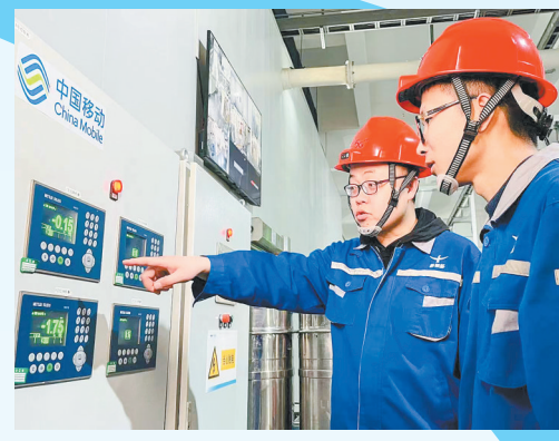
中国移动持续推动5G应用在中原大地开花结果，赋能千行百业，服务河南“十大战略”。

网络强国、数字中国、智慧社会，数字化浪潮正以席卷之势改变各行各业。中国移动胸怀“国之大事”，勇担信息化建设主力军，以建设世界一流信息服务科技创新公司的新成效建功新时代。 近年来，中国移动始终将河南作为主要战略合作地区和业务发展重点支持区域，充分发挥全球网络规模、客户规模以及5G创新引领和产业链整合能力等优势，全面助力数字河南建设，为推动经济社会高质量发展、满足人民美好生活向往贡献移动力量。 率先建成覆盖全省城乡的5G网络、承建河南唯一的综合性工业互联网平台、构建云网深度融合的中部算力中心、打造一批行业领先的5G标杆应用……自2020年中国移动与河南省政府签署战略合作协议以来，在建设5G精品网络、加快5G研发创新、推动5G产业发展、深化5G场景应用等领域取得丰硕成果，全方位助力河南打造数字经济发展新高地。