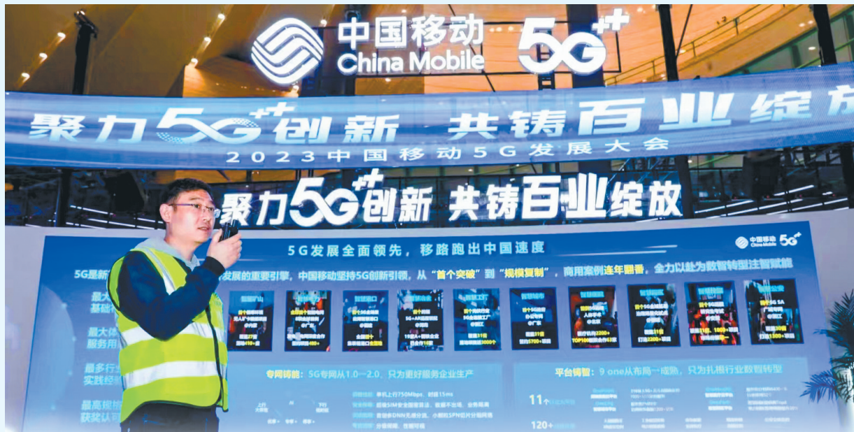
5月5日，河南省政府和中国移动签署新一轮战略合作协议，加快推进数字化转型和数字河南建设。

网络强国、数字中国、智慧社会，数字化浪潮正以席卷之势改变各行各业。中国移动胸怀“国之大事”，勇担信息化建设主力军，以建设世界一流信息服务科技创新公司的新成效建功新时代。 近年来，中国移动始终将河南作为主要战略合作地区和业务发展重点支持区域，充分发挥全球网络规模、客户规模以及5G创新引领和产业链整合能力等优势，全面助力数字河南建设，为推动经济社会高质量发展、满足人民美好生活向往贡献移动力量。 率先建成覆盖全省城乡的5G网络、承建河南唯一的综合性工业互联网平台、构建云网深度融合的中部算力中心、打造一批行业领先的5G标杆应用……自2020年中国移动与河南省政府签署战略合作协议以来，在建设5G精品网络、加快5G研发创新、推动5G产业发展、深化5G场景应用等领域取得丰硕成果，全方位助力河南打造数字经济发展新高地。