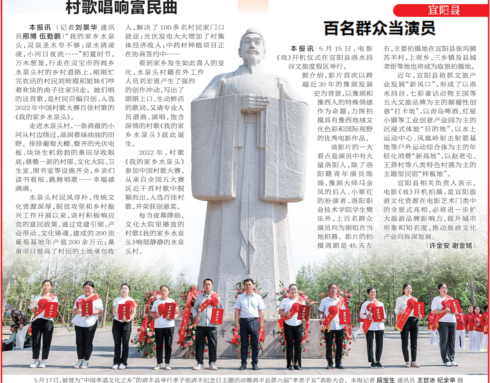
5月17日，被誉为“中国孝道文化之乡”的清丰县举行孝子张清丰纪念日主题活动暨清丰县第六届“孝老子女”表彰大会。本报记者 段宝生 通讯员 王世冰 纪全举 摄

宜阳县相关负责人表示，电影《戏》开机拍摄，是宜阳旅游文化资源在电影艺术门类中的全景式亮相，必将进一步扩大旅游品牌影响力，提升城市形象和知名度，推动旅游文化产业向纵深发展。(许金安 谢金铭)