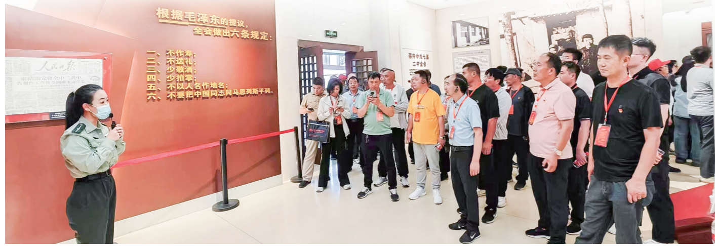
接受革命传统教育

本报讯 截至9月1日,汝州市共举办“万名党员进党校”培训班93期次,培训党员2.4万余名,掀起了党员教育培训的新高潮。今年6月底,全国组织工作会议在北京