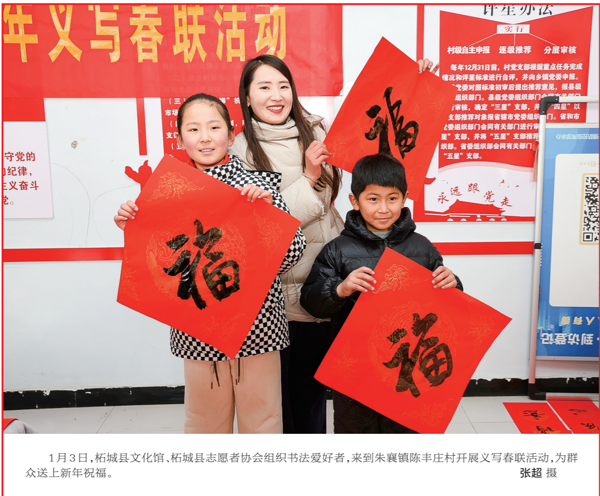
1月3日，柘城县文化馆、柘城县志愿者协会组织书法爱好者，来到朱襄镇陈丰庄村开展义写春联活动，为群众送上新年祝福。

马家乡党委、乡政府近年来以农业供给侧结构性改革为主线，着力调整种植结构，打造品牌战略，扩大红薯种植规模，延伸产业链条。目前，除李庄村外，东坡村也开辟“百亩红薯种植基地”，其他各村红薯种植面积不断增加。（王都君 马保付）