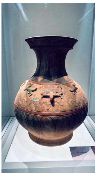
仿汉彩绘陶壶 董强峰作品