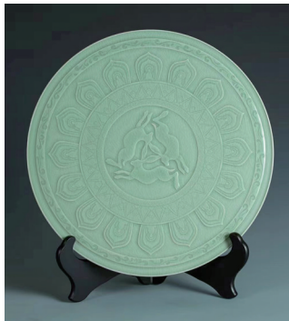
三兔共耳玉璧 张翠芳作品