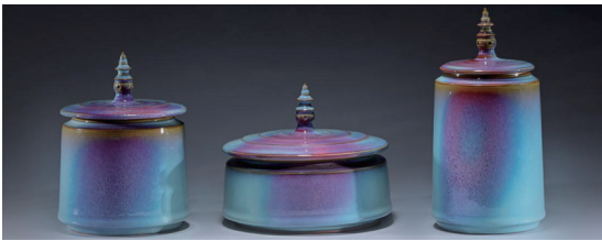
三潭印月 张小帅作品