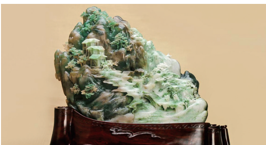
绿水青山图画卷 件孟超作品