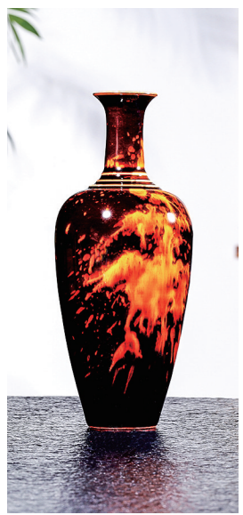
玳瑁花器 柯君丽作品