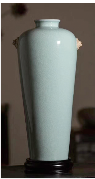
中华尊 杨聚斌作品

当代钧瓷的卓越代表。中国古代哲学有大巧若拙、大音希声、天人合一、无为而无不为的描述，该作品正是对此境界的艺术再现，也完美地表达了中国传统思想中“以器载道”“以道驭器”的至高准则。