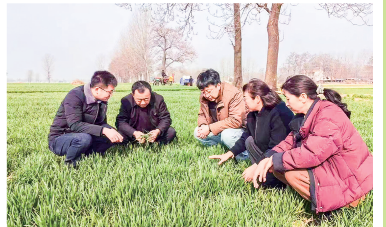
3月以来,商丘市睢阳区小麦返青迅速,但土传病害加速蔓延。为确保全区84万多亩小麦丰收,连日来,该区组织农业专家深入一线,向群众传授病虫害防治技术。重点解决纹枯病、茎基腐病等病虫害,指导科学用药,强调绿色防控。督促各乡镇统防统治,确保夏粮丰收。本报记者李燕 见习记者陈炫羽 通讯员李冠耀摄

导,扎实开展春季管理;及时印发《睢阳区2024年小麦春季病虫害防控指导意见》8万余份,并组织召开小麦春季病虫害防控培训会,由农技专家对全区各乡镇农技人员、种粮大户、科技示范户就病虫害防控进行专题培训。同时,组织农技人员60余人,组成6个小麦春季管理服务小组,出动宣传车6台,分赴各个乡镇开展春季管理指导。 “培训和宣传重点围绕当前小麦病虫害的防治方法,解答群众在病虫害防治时遇到的技术难题,指导群众科学用药,强化绿色防控,指导各乡开展统防统治。”睢阳区农业农村局相关负责人表示,区农业农村局将密切关注小麦病虫害的发生发展趋势,加强监测预警,对重点区域加强病虫害普查,落实关键技术措施,适时组织应急防控,防止病虫害大面积暴发。