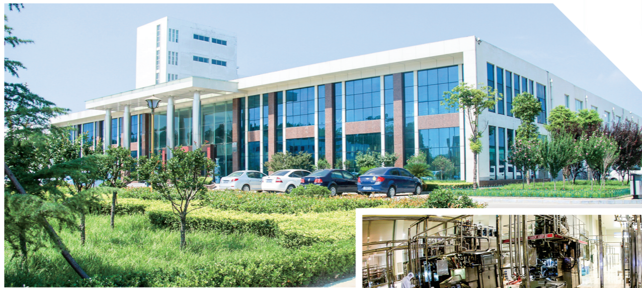
集生产办公于一体的公司总部

坚持“公司+基地+农户”的农业产业化经营模式，该公司先后获评河南省后备上市企业、AAA级信用企业、全国农产品加工业示范企业、国家级高新技术企业。