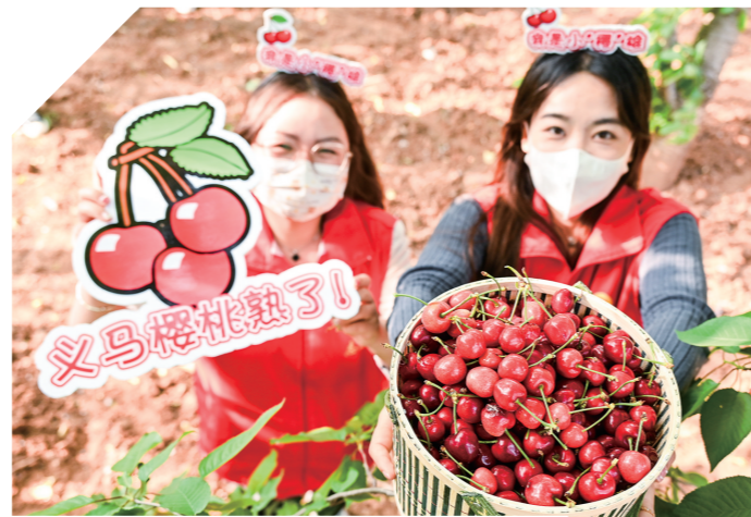
义马樱桃成熟了

与此同时，义马市注重在小而精上做文章，积极发展设施农业、智慧农业。截至目前，义马大樱桃、石门杂粮、付村花椒等特色农业品牌已经初具规模，叫响市场。