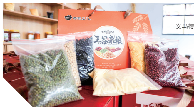
老家石门生产的杂粮产品