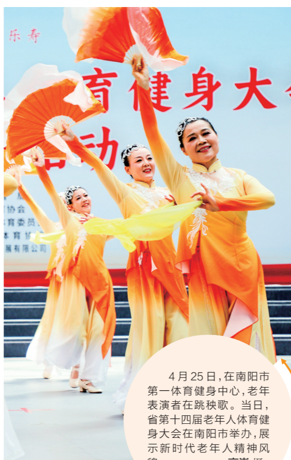
4月25日,在南阳第一体育中心,老年表演者在跳秧歌。当日,省第十四届老年人体育健身大会在南阳市举办,展示新时代老年人精神风貌。