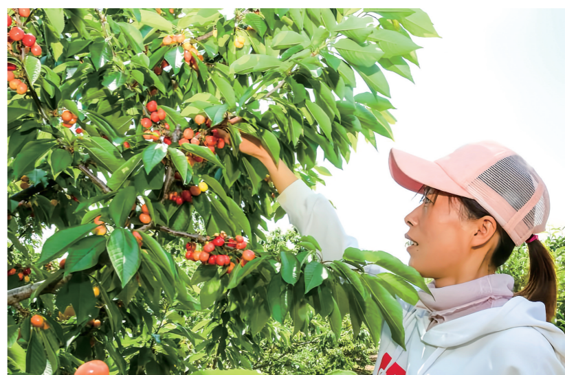
5月8日，商丘市梁园区刘口镇西刘村，果农在采摘樱桃。近年来，刘口镇大力发展以大樱桃、水蜜桃为主的特色产业，其中西刘村大樱桃种植面积3000余亩，吸引周边群众前来体验采摘乐趣。本报记者 李燕 见习记者 陈炫羽 通讯员 邢栋 摄