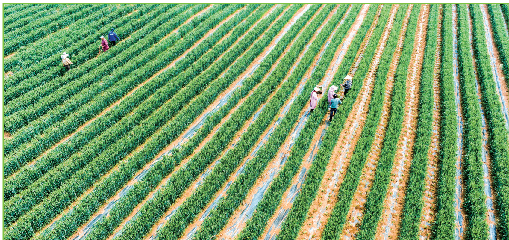
5月8日，宜阳县盐镇乡各村村，村民正在麦田里套种辣椒。近年来，该县不断探索套作模式，发展数字化、规模化、集约化套作模式10万亩。

人好事“看得见、摸得着、够得着”，倡导睦邻友好、乐于奉献、尊老爱幼的文明新风；同时将产业发展、基层治理等涉及群众切身利益的事项进行公布，保障群众的知情权、参与权、决策权和监督权，推动村级事务在“阳光”下运行，树立“村兴我荣、村衰我耻”的集体荣誉感。 “下一步，淇县各村级党组织将进一步增强政治领导力、思想引领力、群众组织力、社会号召力，把群众凝聚在党的周围，为高水平‘品质淇县’建设汇聚磅礴力量。”淇县县委书记杨建强表示。