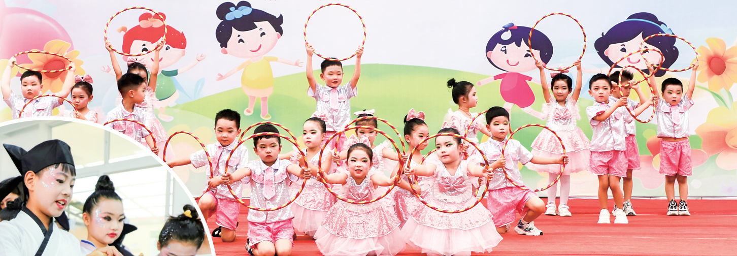
5月28日,郑州市城区三小附属幼儿园举行以“缤纷童年花儿开 筑梦成长向未来”为主题的“六一”文艺汇演。