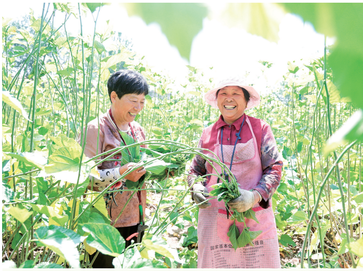
6月27日，柘城县伯岗镇伯东村河南柘桑生态园员工正在采摘桑叶。该生态园占地200余亩，并建立了深加工车间，研发生产桑叶茶、桑菊茶、桑叶面条、桑葚酒、桑葚干、桑芽菜等系列绿色健康食品，引领带动当地50多户农户增收致富。