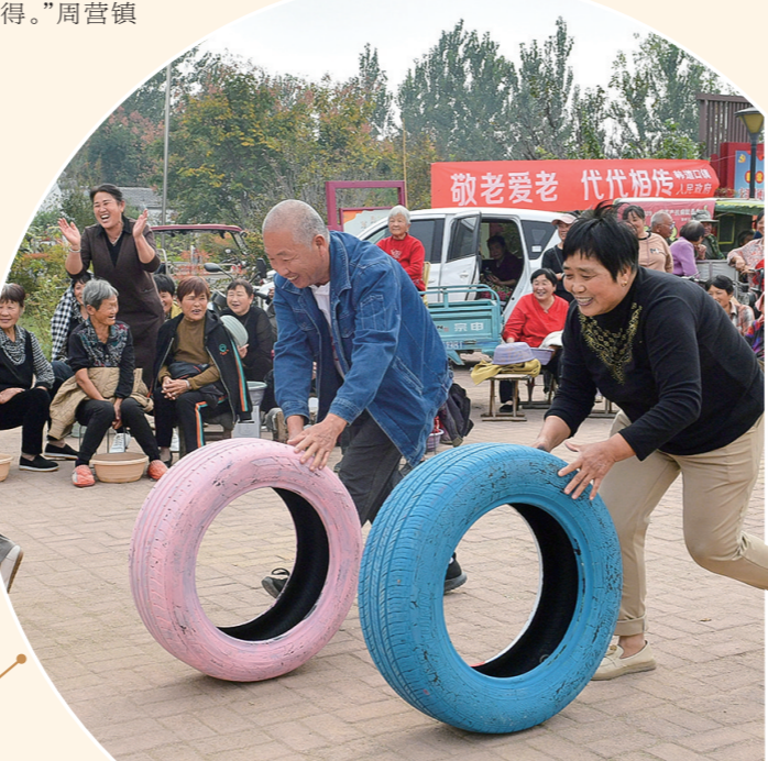
10月10日,夏邑县韩道口镇西村组织村民表演节目、参与趣味游戏,与老人一起欢度重阳节。

“今天的活动举办得很好,参与感很强,给我们带来了无比的快乐!”饶维华阿姨竖起大拇指连连称赞。此次活动,既丰富了老年人的精神文化生活,也为老年朋友们传递健康向上的运动精神,让他们真切感受到社区生活的温馨与快乐,真正实现“老有所养,老有所为,老有所乐”。