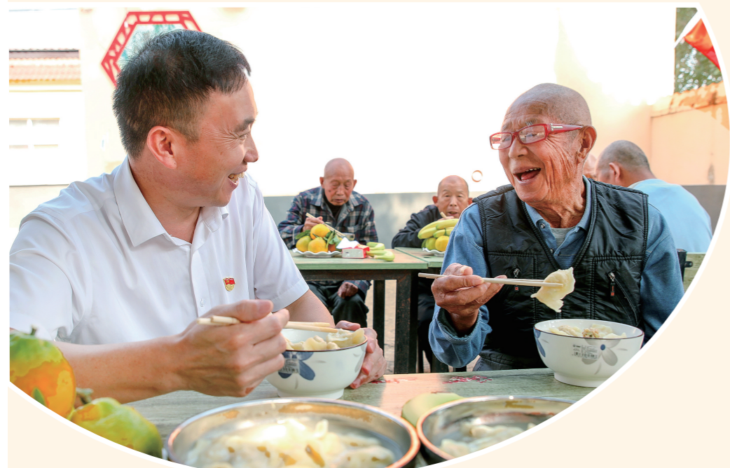
10月11日,尉氏县门楼镇乡文明实践站的志愿者来到该乡敬老院,为老人们表演文艺节目、包饺子,喜迎重阳节的到来。