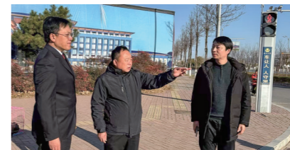
12月16日，洛宁县检察院办案检察官和人大代表、政协委员一起查看道路整改情况，开展公益诉讼案件“回头看”活动。