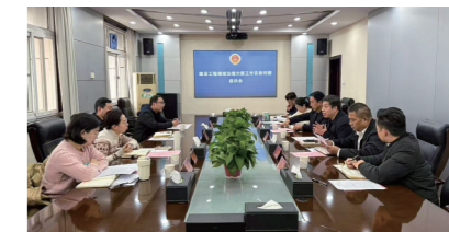
近日，洛阳市人民检察院联合瀋河回族区人民检察院、人民法院、人力资源和社会保障局召开治理欠薪工作座谈会，持续推进“护民生”专项行动。