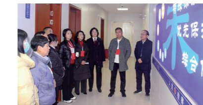
近日，洛阳市人大常委会示范区工作委员会一行到高新区检察院未成年人关护中心，近距离感受检察机关守护未成年人健康成长等工作。