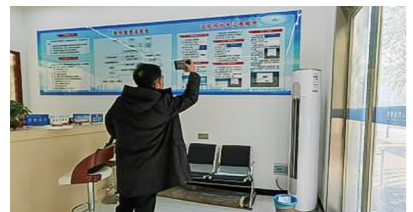
伊川县人民检察院积极推进律师互联网阅卷工作，提升律师执业权利服务保障水平。

多次开展税收政策、会计政策等培训，优化服务，为街道经济发展和民生改善提供坚实的财政支持。（张传军 鹿兴汉）