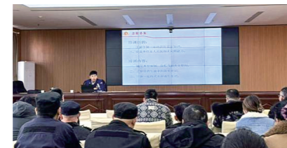
洛阳市偃师区人民检察院特邀偃师消防大队专业人员举办消防安全培训，进一步增强“人人讲安全”的防范意识、警觉意识。