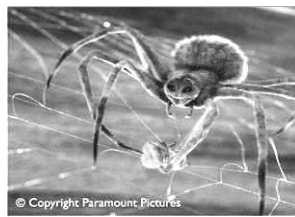
在这个假期里,我读了一本感人至深的书,叫《夏洛的网》。他是美国E.B.怀特的著作,讲述的是一只名叫夏洛的蜘蛛与一头小猪之间的友谊。

故事发生在朱克曼家的谷仓里,那里快乐地生活着一群可爱的动物,其中小猪威尔伯和蜘蛛夏洛之间建立了最真挚的友谊。可是一个最丑恶的消息打破了谷仓的平静,因为威尔伯未来的命运竟会成为熏肉火腿。作为一只猪,悲痛欲绝的威尔伯似乎只能接受任人宰割的命运了。然而,看起来渺小的夏