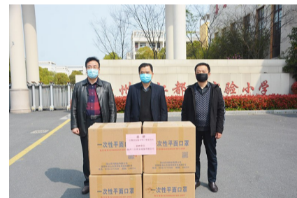
扬州三江环安设备有限公司助力我校疫情防控工作。