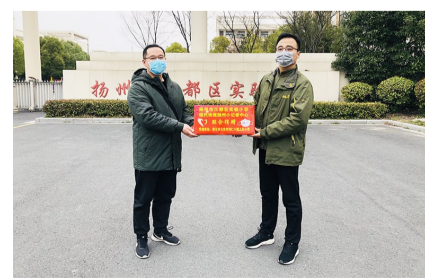
我校与《现代时报》扬州小记者中心携手为湖北省黄石大冶市刘仁八镇上纪小学捐赠医用防护口罩。