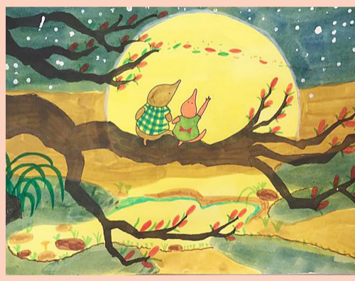
二(9)班 吴洋轩 《鼯鼠的月亮河》