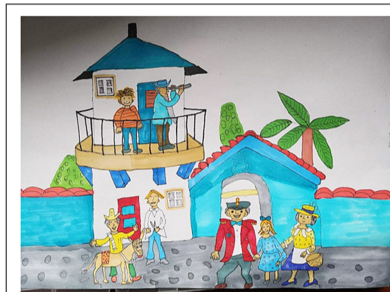
二(1)班 徐君浩 《豆蔻镇的居民和强盗》