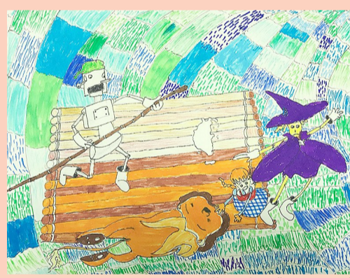
二(14)班 薛开瑞 《绿野仙踪》