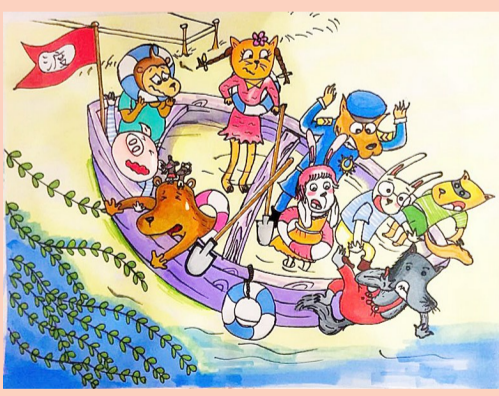
一(3)班 高涵涵 《笨狼的故事》