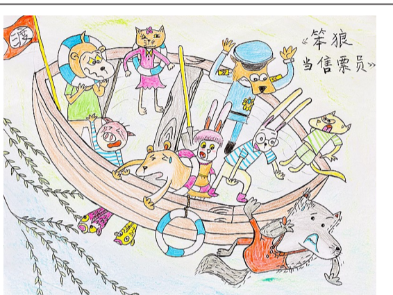
一(9)班 姜雨晟 《笨狼的故事》