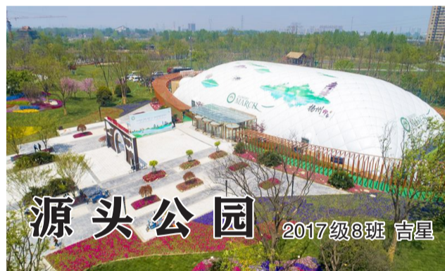
源头公园 2017级8班 吉星