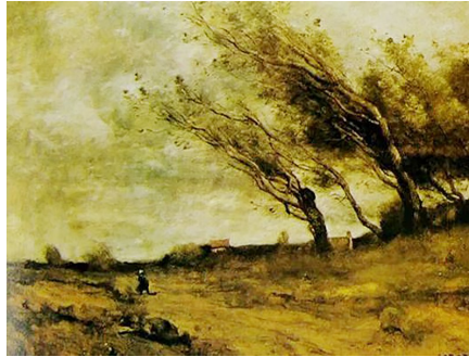
《风》 法国 柯罗

古人说“读万卷书,行万里路。”书就是路,是漫长的旅程,是需要用一生去探索的宝贵财富。