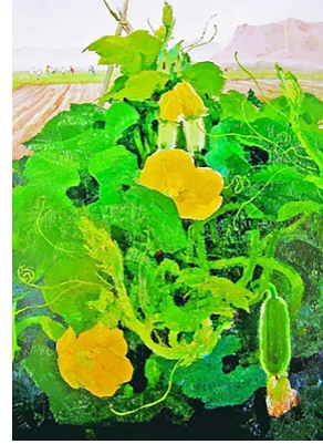
现代 吴冠中 《菜地》