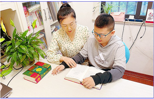
妈妈是历史老师,恰巧我对历史也非常感兴趣。暑假,我就与妈妈共读了《林汉