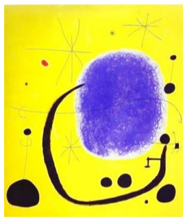
西班牙 米罗 《星星》