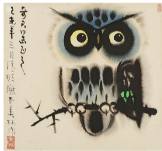
现代 韩美林 《猫头鹰》