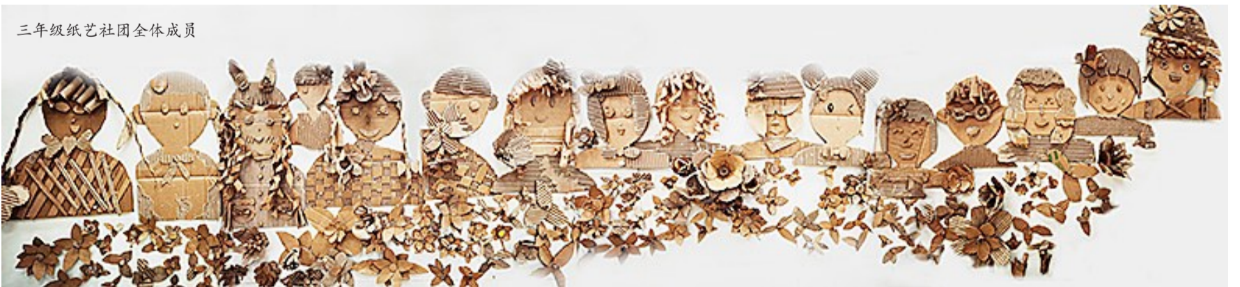
三年级纸艺社团全体成员