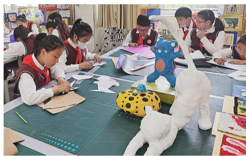
协力创作森林王国