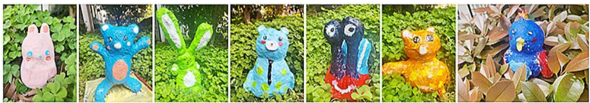
四年级纸艺社团成员:韩熠瑶 翁宇涵 吴好涵 侯心蕊 高子涵 潘言 文杨彤 庄梓妍 吕兰昊 夏雨妍 徐夏韵