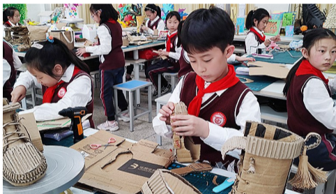
心灵手巧的男子汉