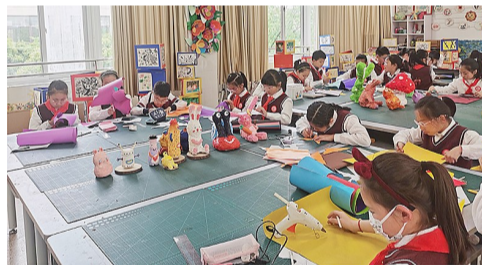
绚丽多姿的纸浆雕塑