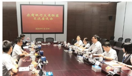
太仓农商银行交流会场

全国各省、市、区农合机构资本充足状况差异较大，至2019年三季度末，有23个省、市、区农合机构资本充足率超过监管10.5%要求，资本充足率最高的省份可达16.19%，有16个省、市、区农合机构资本充足率比上年末提高，但也有少数农合机构由于风险持续暴露，资本充足率较低。对比同业，2019年三季度末，农商银行资本充足率为13.05%，高出城商行0.54个百分点，略低于国有大中型银行和股份制银行。（下转第4版）