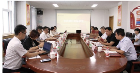
联盟秘书处与河北部分农信机构负责人座谈交流