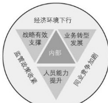
图1 农商银行面临的外部和内部环境分析

农商银行面临的外部环境如图1所示。相较于其他金融机构,农商银行的发展具有以下几个特点:本地化特色十分鲜明,资金的筹集与运用比较合理,信息的获取效率比较高,同时农商银行的经营范围受地域限制,贷款的集中度较高,不利于风险的分散;融资渠道匮乏、业务扩张因资本扩增受限等诸多因素都不利于农商银行的发展。2017年以来,国家分别出台了同业市场治理和理财市场整顿的相关文件,政府对中间业务的监管力度不断加大,加之同业竞争日趋激烈,农商银行不得不进行业务转型,回归本源。