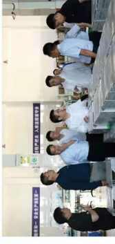
与会人员参观威海新时代海洋生物科技有限公司

在主题活动中总结了农商银行服务“三农”的金融服务特点,与参会人员一同走进了农商银行的“三农”客户——农业企业“威海新时代海洋生物科技有限公司”。该企业成立于2010年8月,拥有海岸线1.5万余亩,年产鲜带鱼等藻类20余万吨,生产设施建筑面积3.2万平方米,生产设备300余台(套),其中自主创新研发率达85%以上,获得多项国际高新技术成果和专利授权,承担多项省级以上重大科技创新、农业科技成果转化课题。