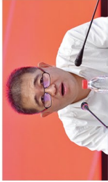
浙江省地方法金融监督管理局党组书记、局长张雁云讲题

2021年6月9日至10日,全国农信系统助力服务乡村振兴暨中国银行业协会农村合作金融工作委员会(以下简称农合委)第六届第一次全体会员联席会议在杭州召开。浙江农信地方法金融监督管理局党组书记、局长张雁云,中国银行业协会党委管理委员会委员、中国银保监会一级巡视员张金辉、普惠金融部二级巡视员赵凤娥、浙江银保监局一级巡视员周立新出席会议并讲题;浙江省联社理事长、中国银行业协会第六届农合委委员会主任王小龙出席会议并作农合委2021年度工作报告。来自北京、天津、河北、山西、内蒙古等28家农合委成员单位主要领导及相关单位负责人参加了会议。会议由中国银行业协会党委委员、副秘书长,农合委委员专职副主任张芳主持,并开会议小憩。