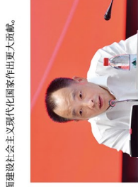
浙江银保监局一级巡视员周立新讲题

结合全面加强乡村振兴战略的新形势新要求,针对农信系统存在的主要问题,她强调要进一步抓好以下工作:一是多方合力,压实责任,推动农村信用社与不良资产处置;二是不断加强股权质押与不良资产管理、健全法人治理结构,不断完善规章制度,完善内控管理;三是倡导产品、模式、方式等创新,进一步提升服务“三农”及小微企业的能力;四是