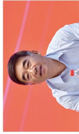
中国银行业协会党委书记、秘书长张敬祥

会议审议通过了《中国银行业协会农村合作金融工作委员会2021年度工作报告》《关于组织开展全国农村合作金融机构互助基金100周年系列活动方案》《全国农村中小银行机构行业发展报告(2021)编写方案》《2021年度农村台机构专题交流及调研活动方案》《全国农村合作金融机构高层管理人员培训计划方案》等五项议案。