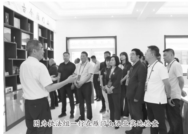
图为执法组一行在雁门山酒业实地检查

检查组首先听取了县市场局、农业农村局、教育科技局、综合检验检测中心关于《食品安全法》及相关法律、法规贯彻实施情况的专题汇报;并结合现场翻阅相关资料等方式,对检查内容进行了系统深入地掌握和分析;随后,深入第二幼儿园、新全超市、综合检验检测中心、雁门山酒业和润明饼业进行了实地检查。