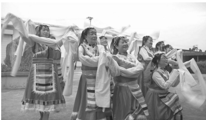
歌舞表演《我的家乡是天堂》

本报讯(记者 班秀龙)8月1日下午,代县农业产业发展中心离退休干部党支部组织新老干部欢聚一堂、激情满怀、载歌载舞,欢庆“八一”建军节,她们用自己最淳朴的方式表达了对当代军人的深情厚谊,致敬守护祖国平安“最可爱的人”!