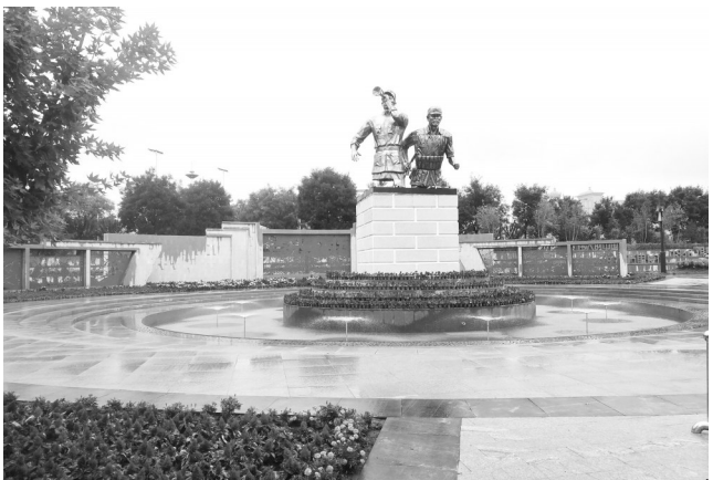
代县雁门公园新城综合配套工程项目

惠民生、暖民心。近年来,代县加速推进民生实事项目,加快实施城市更新行动,优化城市功能,提升城市品质,不断提升人民群众的幸福感和获得感。新城区建设项目西起二虎寺河,东至东环路,南界京原铁路,北至新108国道,规划用地面积4.8平方公里,规划人口规模控制为5.5万人。新城综合配套提升工程项目是包括4个