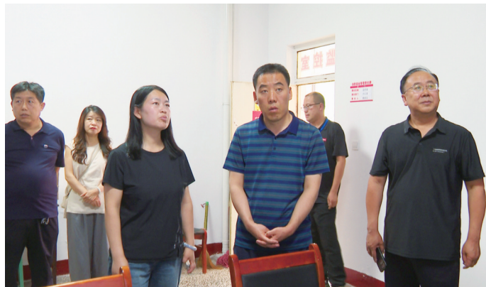
在代县初中部考点监控室调研

在代县中学,张志杰一行重点查看了考场布置、监控设备运行情况,详细询问了考务安排、应急预案制定等工作细节。他强调,中考事关千家万户切身利益,各责任单位要树牢底线思维,聚焦考生需求,统筹教育、公安、住建等多部门力量,从安全保障、交通疏导等方面精准施策,为全县考生构筑起全方位护考屏障。要对考场设施设备进行再检查、再调试,对食品安全、电力供应等保障工作进行再细化、再落实,以严谨细致的工作态度和周密完善的保障措施,为考生营造安全有序、公平公正的考试环境,助力莘莘学子从容应考。