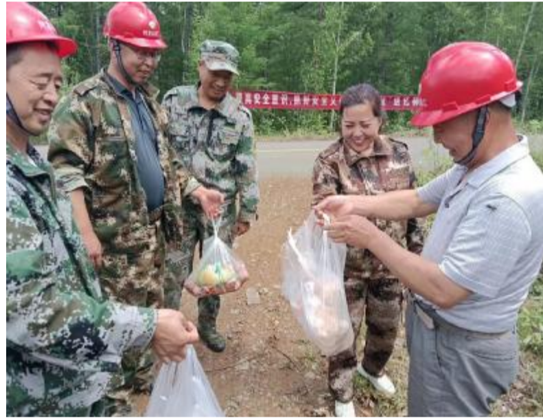
6月22日,阿龙山森工公司阿乌尼林场工会组织人员深入正在开展退化林修复工作的3个工队进行慰问,送去鸡、猪肉等慰问品。

该林场组织人员深入远山林地、田间地头进行全方位踏查,对废弃院落、房前屋后进行仔细排查,做到踏查、排查不留死角、不存盲区、不走过场,实现毒品原植物“零种植”的目标。