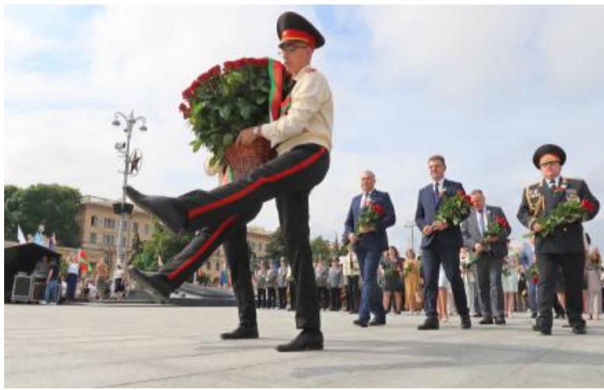
7月3日,人们在白俄罗斯明斯克胜利广场向胜利纪念碑献花。白俄罗斯3日举行活动,纪念国家独立日暨二战中从德国法西斯占领下解放78周年。